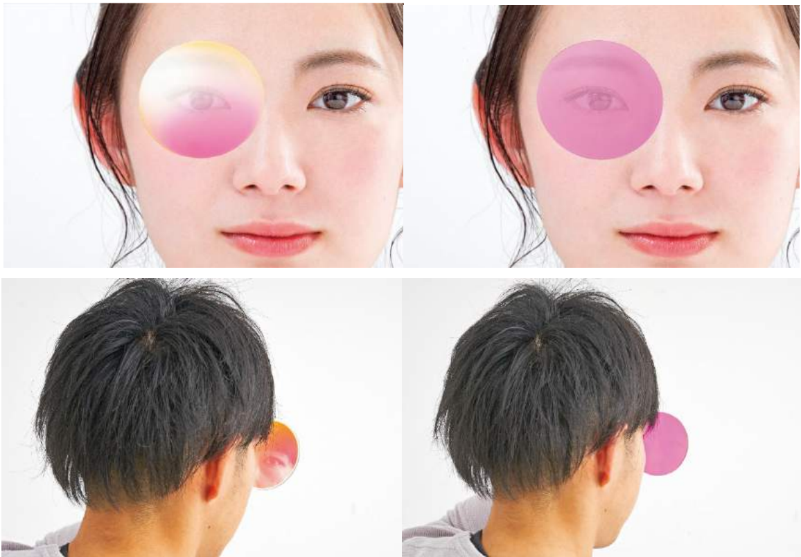
【従来レンズとの比較（左：従来品、右：新色覚補正レンズ）】